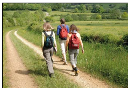
Soleil de Gaume

ou le 084 410 210 de la Fédération touristique du Luxembourg belge (FTLB).